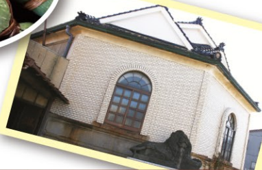
旧直江津銀行 今に残る建物は変則五角形で3つの小屋根を有し、内部には銀行当時の大金庫やカウンターなどがそのまま残されています。