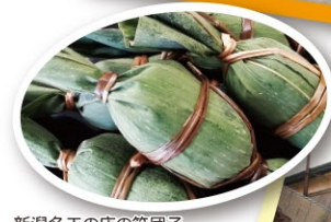
新潟名工の店の笹団子