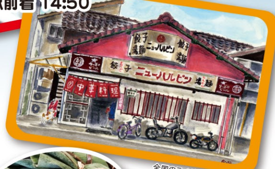
全国のライダーに噂の人気店 ニューハルビン